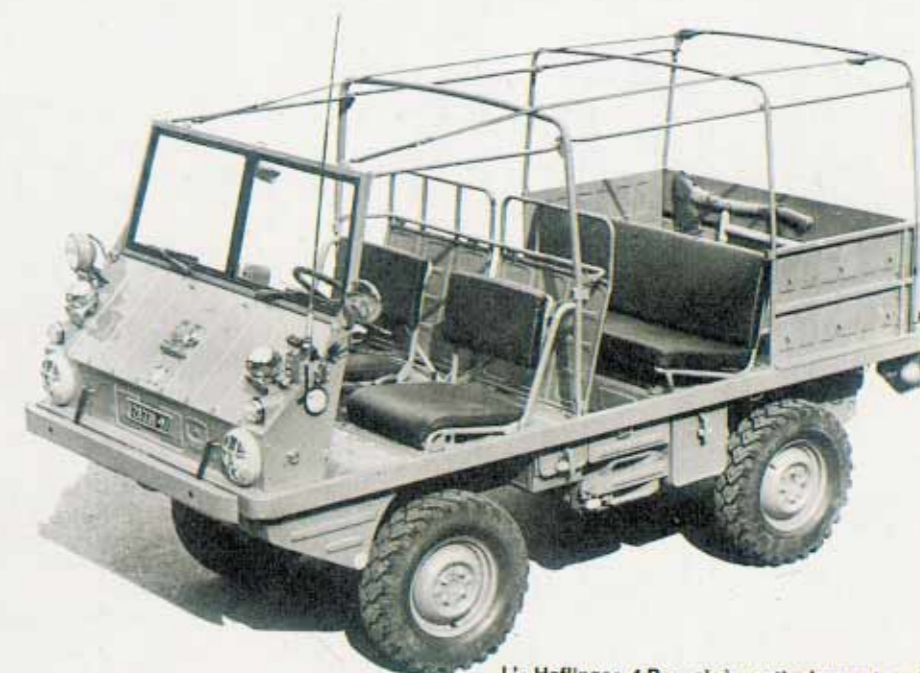
L'-Haflinger 4R -: cioè particolarmente adatto e attrezzato per il fuori strada turistico. Per la sua descrizione rimandiamo al fascicolo di giugno 1966 di «Quattroruote».