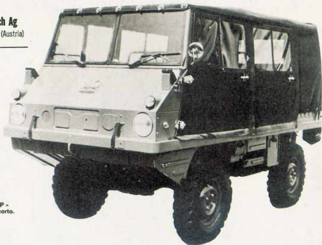
L'-Haflinger 700 AP - versione a passo corto.

STEYR - PUCH Steyr - Daimler - Puch Ag Kärntnering 7, Wien 1 (Austria)