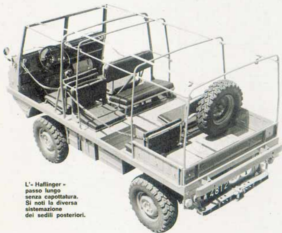
L'-Haflinger - passo lungo senza capottatura. Si noti la diversa sistemazione dei sedili posteriori.